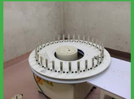
簡易型 ^{137}\text{Cs} ガンマ線照射装置 (BF 照射実験室)