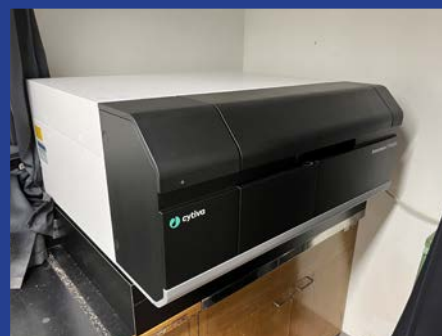
イメージングアナライザー (Amersham™ Typhoon™ scanner) (4F 測定室 2)