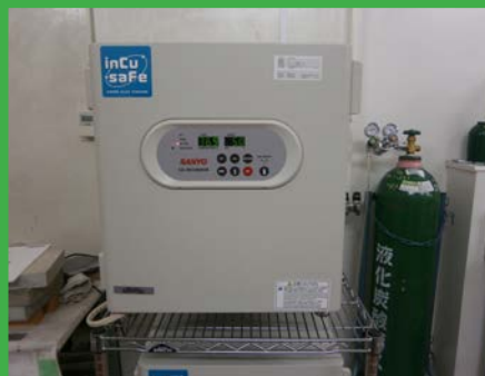
CO 2 インキュベーター (BF 照射装置室)