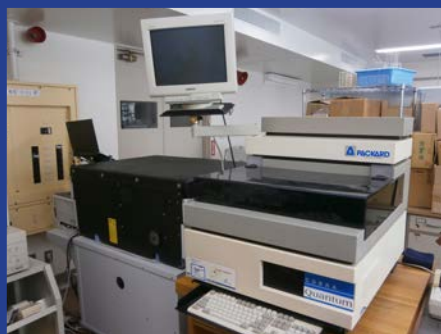
ガンマカウンタ (コブラ クワンタ ム 5003) (4F 測定室 1)