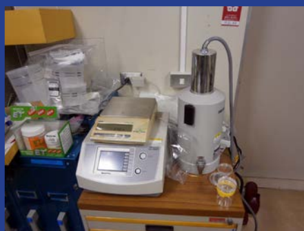
γ線シンチレーション測定装置 (4F 測定室 1)