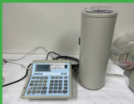
RI キャリプレート（CRC-25W） (4F 動物実験室 3)