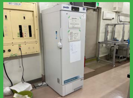
フリーザー（動物用） (BF 照射装置室)