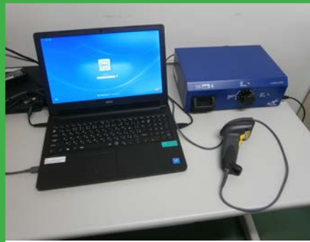
OSL 線量計 (micro star)