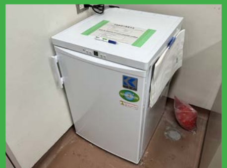
フリーザー（動物用） (4F 洗浄室)