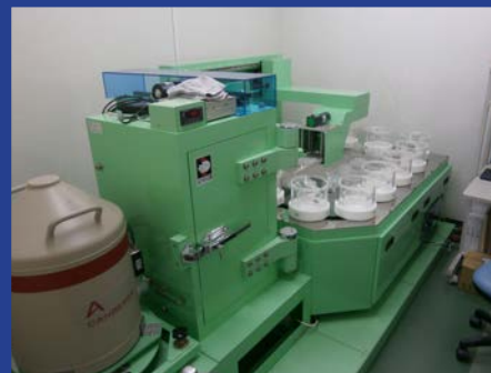
サンプルチェンジャ付ゲルマニウム 半導体検出器 (マリネリ容器測定可) (4F 分析機器室 2)