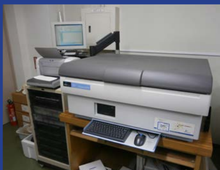
液体シンチレーションカウンタ (Tri-Carb 3100TR) (4F 測定室 2)