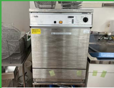
ミーレ全自動洗浄機