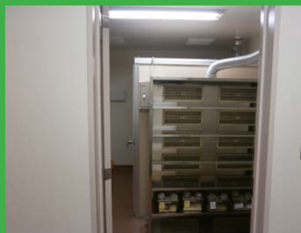
動物飼育棚 (4F 動物実験室 1)