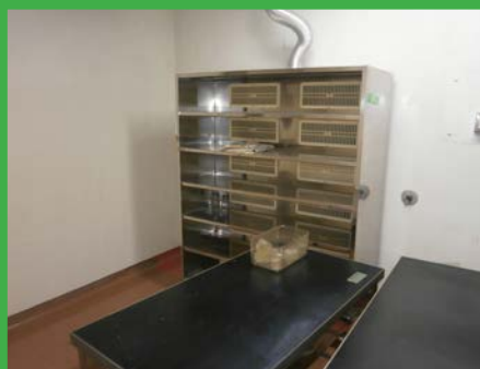
動物飼育棚 (4F 動物実験室 2)