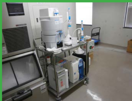
精製水装置（ミリポア濾過方式） (3F 廊下)