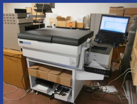
液体シンチレーションカウンタ (Tri-Carb 2910TR) (4F 測定室 1)