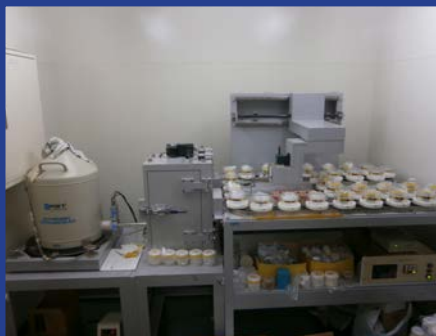
サンプルチェンジャ付ゲルマニウム 半導体検出器 (U-8 容器用) (4F 分析機器室 1)