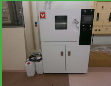
動物乾燥機（ヤマト科学社製） (BF 照射装置室)