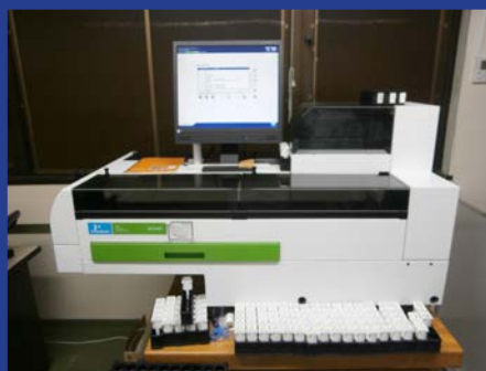
ガンマカウンタ (WIZARD2) (4F 測定室 2)