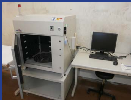
エックス線照射装置 (メディエック スタック MX-160Labo) (BF 照射装置室)