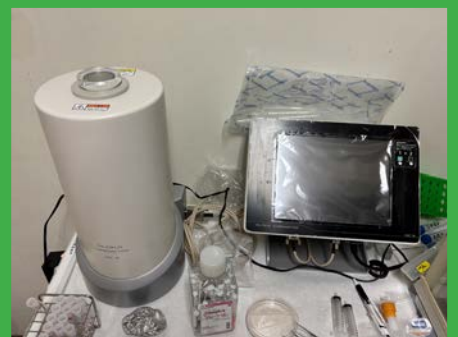
キュリーメーター IGC-8 (ALOKA) (4F 動物実験室 1)