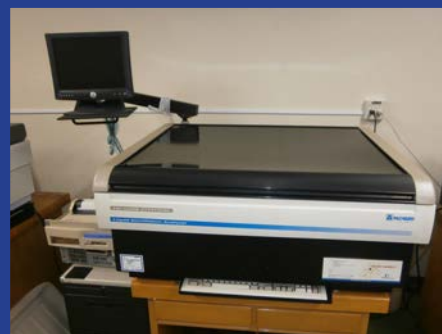
液体シンチレーションカウンタ (2700TR/SL) (4F 測定室 2)