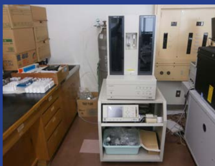
2πガスフローカウンタ (ALOKA LBC-4211B) (4F 測定室 1)