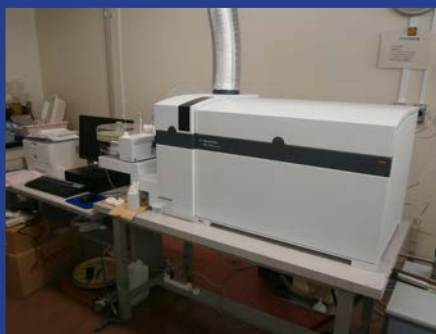
ICP-MS (Agilent 8800 シリーズトリ プル四重極) (4F 測定室 1)