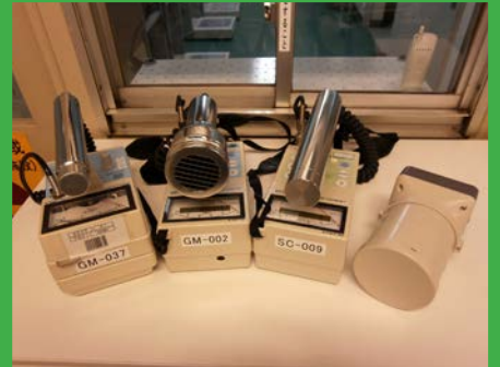
サーベイメータ類