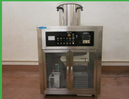
動物乾燥機（宮川科学資材社製） (BF 照射装置室)