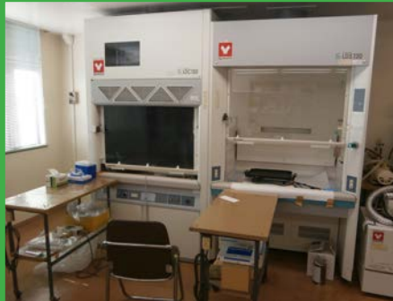
スクラバー付きフード