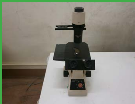
位相差顕微鏡（OLYMPUS CK2） (BF 照射装置室)